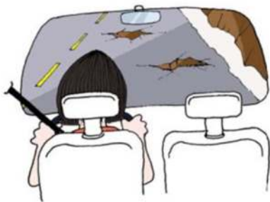
Ilustração do Manual DENATRAN, página 35

Estudos mostram que os motoristas podem dirigir de modo muito mais seguro do que habitualmente o fazem, mas é necessário dirigir analisando as situações e verificando tudo que possa afetá-lo, e assim tomar decisões com antecedência, ou seja, dirigindo de forma preventiva. Observe a figura a seguir.