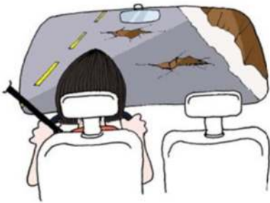
Ilustração do Manual DENATRAN, página 35

Estudos mostram que os motoristas podem dirigir de modo muito mais seguro do que habitualmente o fazem, mas é necessário dirigir analisando as situações e verificando tudo que possa afetá-lo, e assim tomar decisões com antecedência, ou seja, dirigindo de forma preventiva. Observe a figura a seguir.