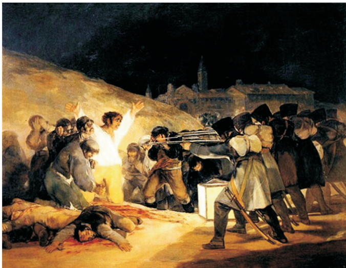
Três de Maio, 1808, Museu do Prado, Madri

Aqui, a cor flamejante, a pincelada larga e fluida e a dramática luz noturna são mais que nunca marcadamente neobarrocas. O quadro tem toda a intensidade emocional da arte religiosa, mas estes mártires morrem pela liberdade e não pelo reino dos céus [...]