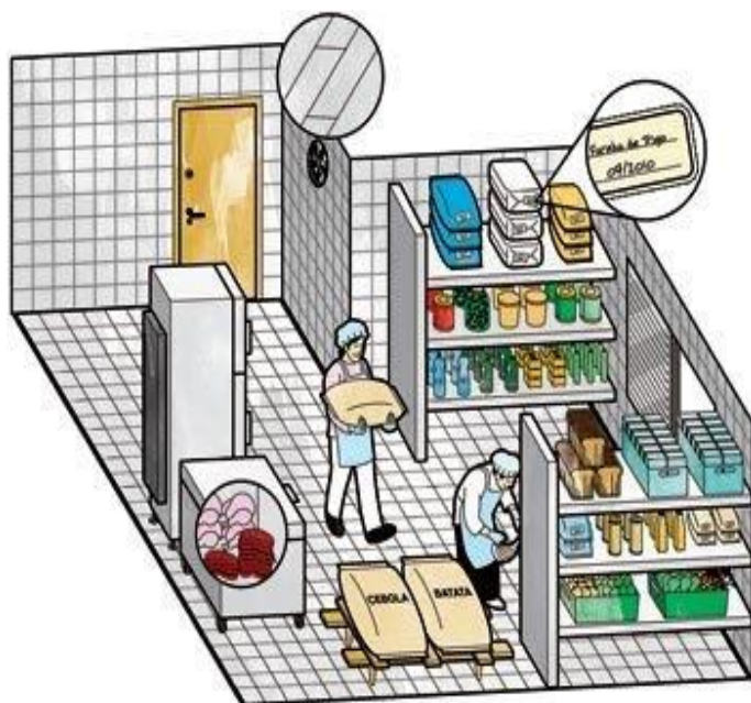
Figura 1-TUDO EM ORDEM Dicas para uma despensa limpa e organizada

A preocupação com a segurança da cozinha começa na escolha dos pisos e revestimentos - que devem ser laváveis, antiderrapantes. Passa por detalhes como a proteção de tomadas e se estende às áreas externas onde devem estar os botijões de gás e o depósito de resíduos sólidos.