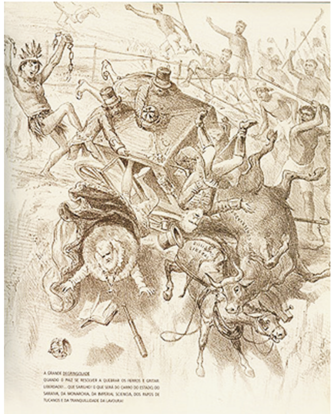
AGOSTINI, Angelo. A grande degradingolade. Rio de Janeiro: Revista Ilustrada, 1885.

Na charge, contextualizada na crise do Segundo Reinado (Brasil, segunda metade do século XIX), AGOSTINI mostra um indígena, simbolizando a nação, rompendo correntes e chutando a carruagem do Império, lançando ao chão o imperador e seus seguidores. Segundo essa analogia, contribuíram para a queda de D. Pedro II: