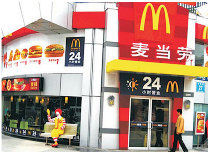
A McDonald's store in Wuhu, Anhui Province. Mc Donald's na China símbolo da abertura da economia chinesa ao mercado internacional.

Com a morte de Mao Tsé-tung (China, 1976), o poder passou às mãos do grupo de Deng Xiaoping, que iniciou a política das Quatro Modernizações: da agricultura, da industrial, da ciência e tecnologia e da defesa militar.