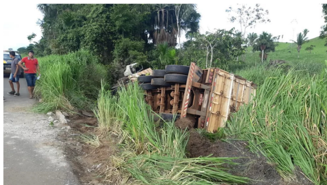
Caminhão tentou desviar de acidente na BR-364 em Presidente Médici, RO, mas acabou tombando.

Outro caminhão que trafegava no sentido oposto tentou desviar, para não bater no caminhão que já estava atravessado na pista, mas também acabou tombando. Ninguém ficou ferido.